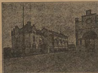
— NORRKÖPINGS ELEKTRICITETSVERK —

Telegrafadress: 20. Riket. 88 81. Allm. 28 80.