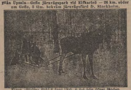
Eigen »Stolta» körd 6 Juni 1906, 6 fot hög öfver länden.