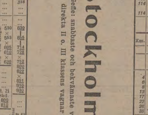
Eigen »Stolta» köda 6 Juni 1906, 6 Tot hög öfver länden.

Från Uppsala-Gefle järnvägspark vid Elfkarleö - 26 km. söder om Gefle, 3 tim. bekväm järnvägsfärd fr. Stockholm.