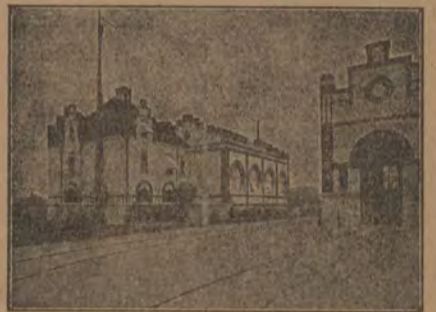
— NORRKÖPINGS ELEKTRICITETSVERK —