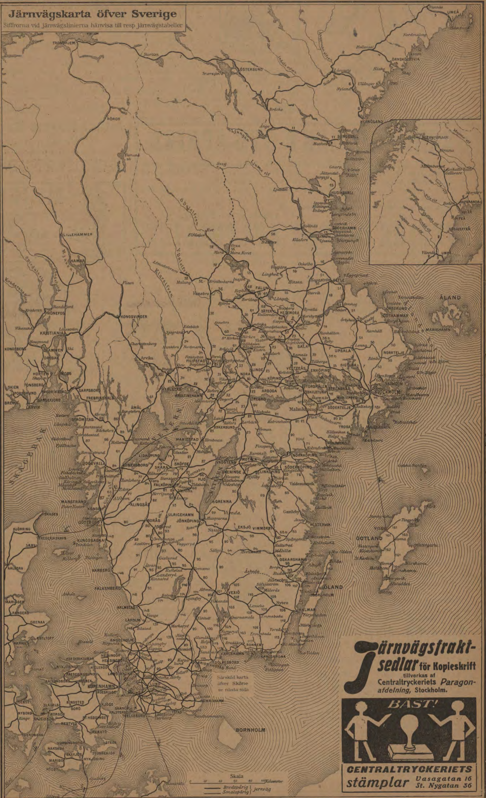
Järnvägskarta öfver Sverige Siffrorna vid järnvägslinierna hänvisa till resp järnvägstabeller

Damm-sugning medels vattenledning! Enkelt! Billigt! Hygieniskt! Redan infört i många hus. Besök Hydro-Cleaner Central-palatset Stockholm.