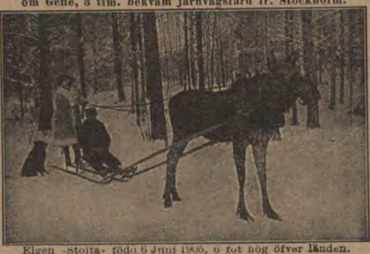
Elgen »stoita» föda 6 Juni 1906, 6 fot hög öfver länden.