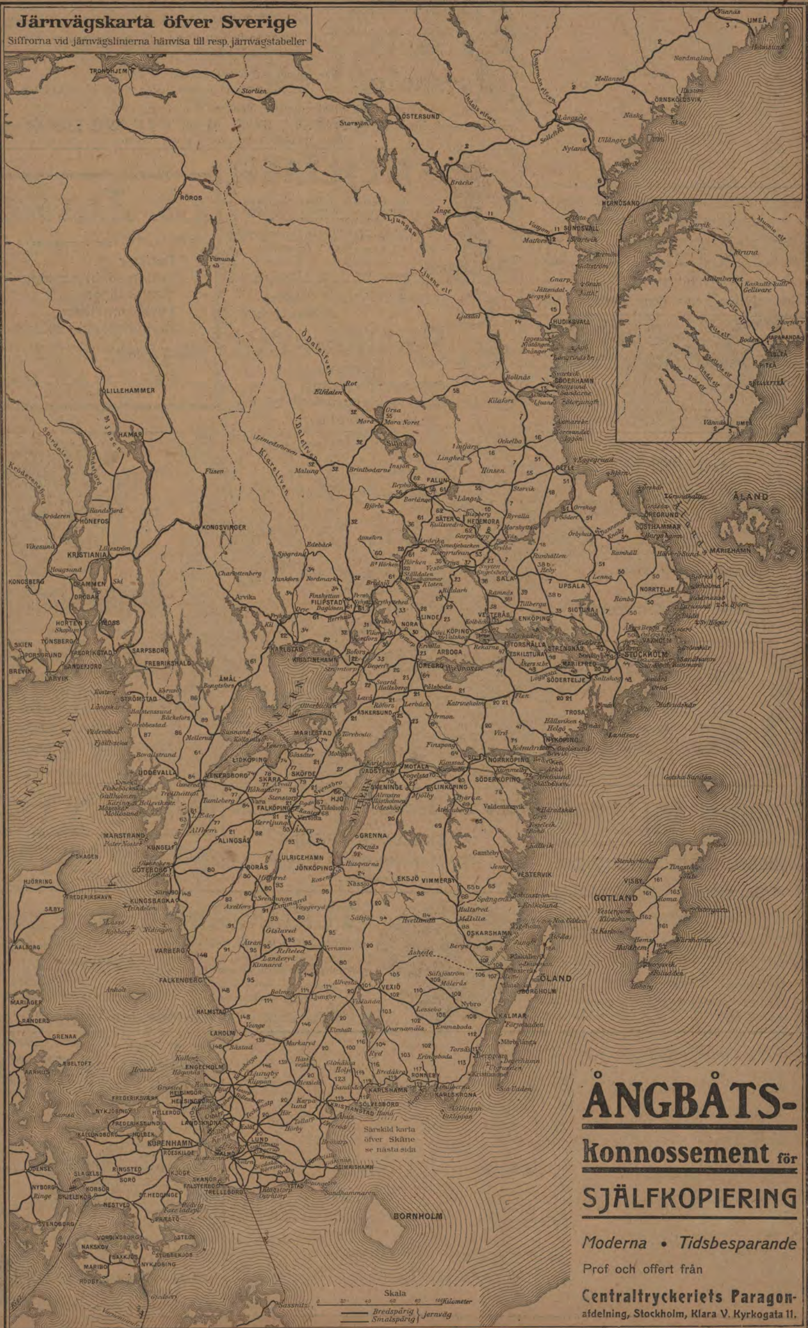
Järnvägskarta öfver Sverige Siffrorna vid järnvägslinierna härvisa till resp. järnvägstabeller