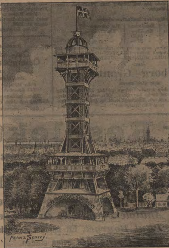
Zoologiska trädgårdens utsiktstorn.